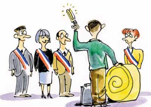
Dessin Desmond BOVEY / ADEME Franche-Comté

L'Europe s'engage en Franche-Comté avec le Fonds européen de développement rural.