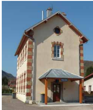
Mairie de Ougney-Douvot

Maîtriser la consommation de l'énergie est un enjeu majeur pour nos territoires. Face à des réglementations encore plus strictes, à une augmentation sans cesse croissante du coût de l'énergie et à une prise de conscience universelle sur les problématiques environnementales que la production et la consommation de l'énergie impliquent, le Pays Doubs Central s'engage et soutient les communes qui souhaitent réduire leurs consommations et leurs dépenses énergétiques.